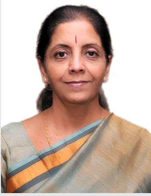
राज्य मंत्री (स्वतंत्र प्रभार) वाणिज्य और उद्योग भारत